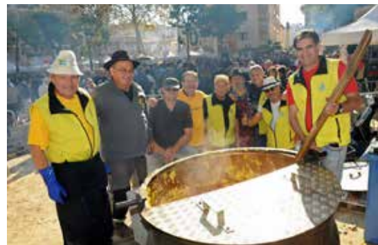
Dégustation gratuite de châtaignes

Les polentiers d'Isola partageront leur savoir-faire en préparant les traditionnelles daube et polenta dès le matin en public sur la place de Gaulle. Vente et dégustation ouvertes à partir de 11h30 : 4 € la portion à déguster sur place ou à emporter (avec le concours des élèves du Lycée Escoffier).