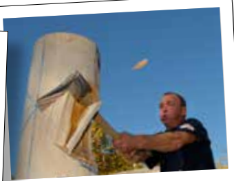
Concours de Bûcherons

Départ à 11h du boulevard Maréchal Juin (parking de la Rotonde) pour rejoindre la place de Gaulle en musique avec les animaux du Haut-Pays.