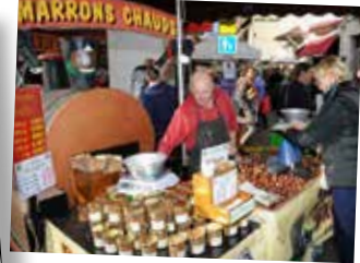
Marché du terroir