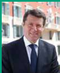
Christian Estrosi Maire de Nice Président de la Métropole Président délégué de la Région Sud Provence-Alpes-Côte d'Azur

« Patrimoine pour tous, ensemble, faisons vivre le patrimoine ». Quel merveilleux thème retenu pour ces 38 èmes Journées européennes du patrimoine !