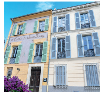
Façade de l'école du Vieux-Bourg

14h : Visite de l'école du Vieux-Bourg. Rendez-vous devant l'école