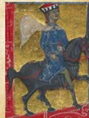
Seigneur de Blacas

18h | Cérémonie de clôture avec les troupes